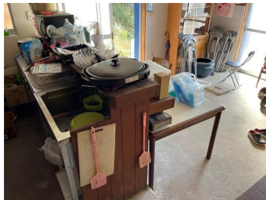
カウンターシンク (改修前)