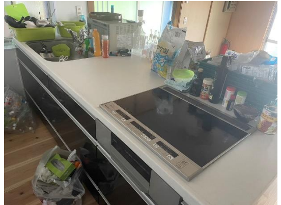
カウンターシンク (改修後)