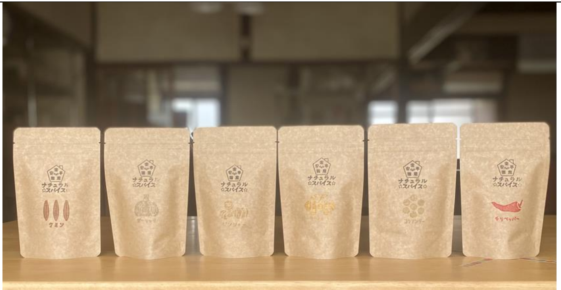
スパイスのパッケージ、各スパイスを生産中。