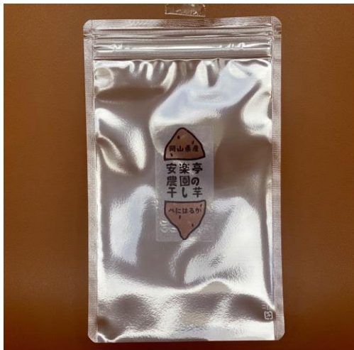
干し芋パッケージ