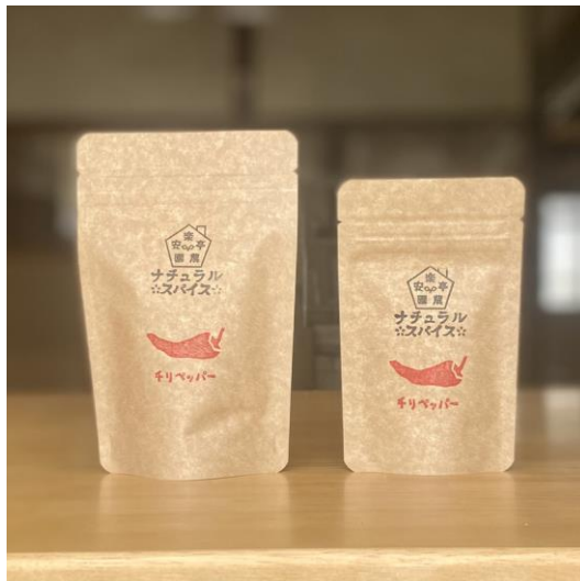
ホール用パッケージ (真空パック機を使用)